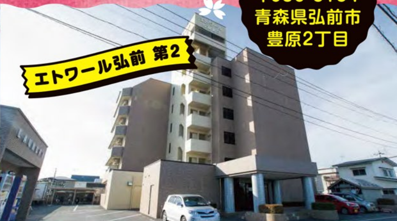
エトワール弘前 第2