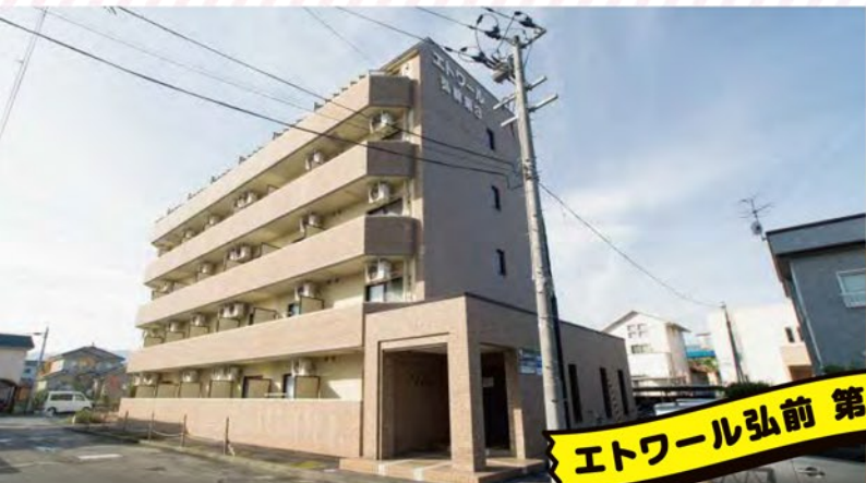
エトワール弘前 第3