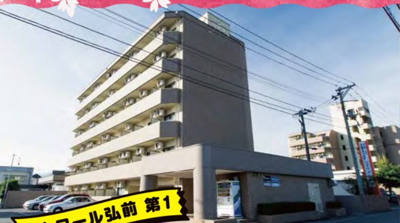
エトワール弘前 第1